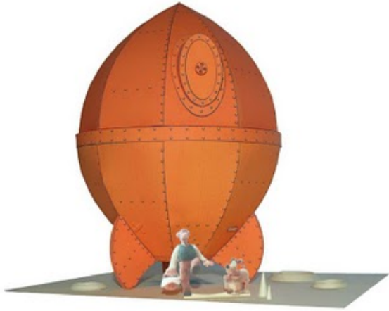
Figure 1: Our spaceship.

placemat sed eros. Aliquam vel urna at libero molestie ornare. Morbi quis lectus mi.