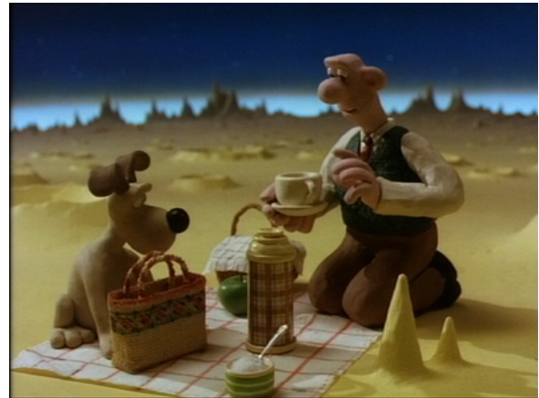
Figure 3: Our picnic.